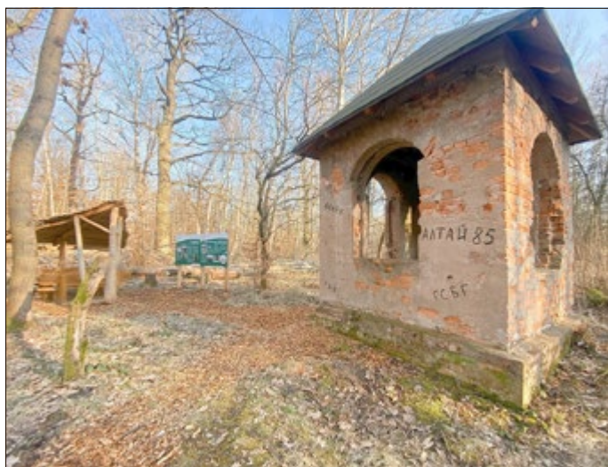
Waldkapelle Hohe Schrecke mit Rastplatz und Infotafel in der Gemarkung Ostramondra

Der Verein Hohe Schrecke - Alter Wald mit Zukunft e.V. möchte an dieser Stelle allen Zeitzeugen herzlich danken, die dem Aufruf im Sommer letzten Jahres gefolgt sind und ihre Erzählungen, Hinweise und Material geteilt haben. Die Aufarbeitung der Waldgeschichte in der Hohen Schrecke ist noch nicht abgeschlossen. Aktuell ist ein Historiker mit der Aufarbeitung der Geschichte in den Jahrhunderten vor der militärischen Nutzung beschäftigt. Die Waldkapelle bei Outdooractive: https://www.outdooractive.com/de/poi/soemmerda/waldkapelle-hohe-schrecke/67944707/ Der Große Hohe Schrecke Rundweg bei Outdooractive: https://www.outdooractive.com/de/route/wanderung/kyffhaeuser/hohe-schrecke-grosser-hohe-schrecke-rundweg/22734355/