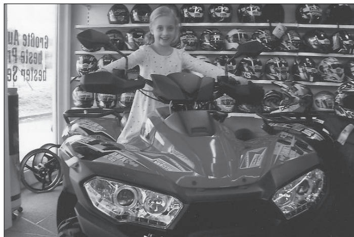
Motorsportnachwuchs „Mira“ übt schon mal.