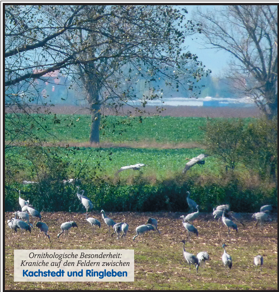
Ornithologische Besonderheit: Kraniche auf den Feldern zwischen Kachstedt und Ringleben

der Stadt Artern und der Gemeinden Borxleben, Gehofen, Heygendorf, Ichstedt, Kalbsrieth, Mönchpiffel-Nikolausrieth, Nausitz, Reinsdorf, Ringleben und Voigtstedt